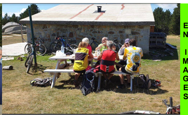
Délégation VTT au refuge de la Balme en Cerdagne