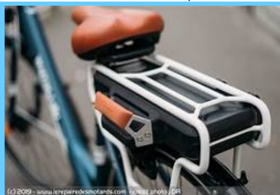
La mallette contenant la batterie, le moteur et le galet d'entraînement est déclipable très facilement

-Aujourd'hui le Wayscral-Michelin est en vente chez Norauto Gramont au prix de 999€.