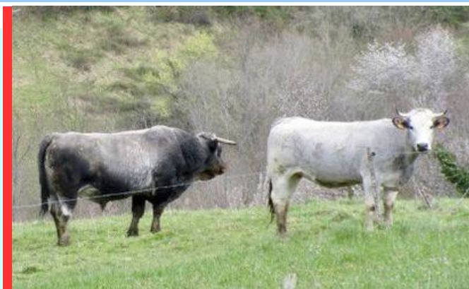
Ça c'était avant que le taureau placide ne franchisse les barbelés pour venir défendre sa conquête du jour et ne se montrât très agressif envers le groupe.Ouf on a eu chaud !!!

Félicitations à Evelyne pour ce CR qui permet d'intégrer le clan des narratrices officielles.