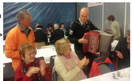
L'accordéoniste charmeur de ces dames.