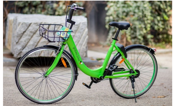
Le vélo vert de Gobee.bike