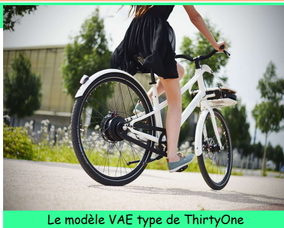
Le modèle VAE type de ThirtyOne

et de Vannes, les verra-t-on un jour en libre service à Toulouse en complément des « velôtoulouses ? »