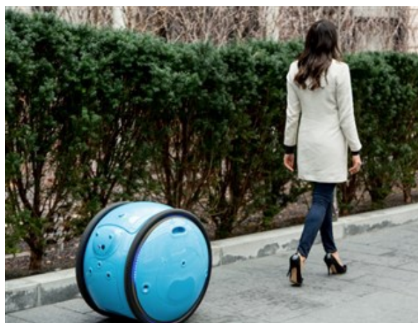
La valise obéissante

Comment prendre les transports en commun sauf à être assimilé à un handicapé?. Comment la transporter quand cela s'avère nécessaire en cas de panne de batterie ou face à une résidence sans ascenseur ? Aucun prix n'a encore fait son marché