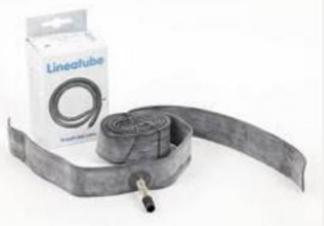
Chambre à air linéaire avec 2 bouts...

-Par contre lors d'une crevaison si vous ne voulez pas démonter la roue, a fortiori si vous avez un VAE à moteur dans la roue arrière, avec une chambre linéaire dans votre trousse de réparation plus besoin de démonter la roue. Opérations: