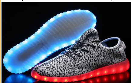
Dans les catalogues oui.... mais dans la rue ?

Après les vélos lumineux (Bull n°109 ) voilà que les