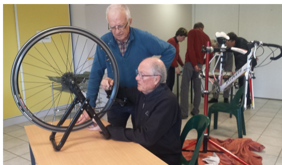
Nos deux spécialistes de redresseurs de roues en action

Depuis mars l'atelier Gauguin est équipé d'un centreur de roue, outil indispensable pour vérifier si la roue